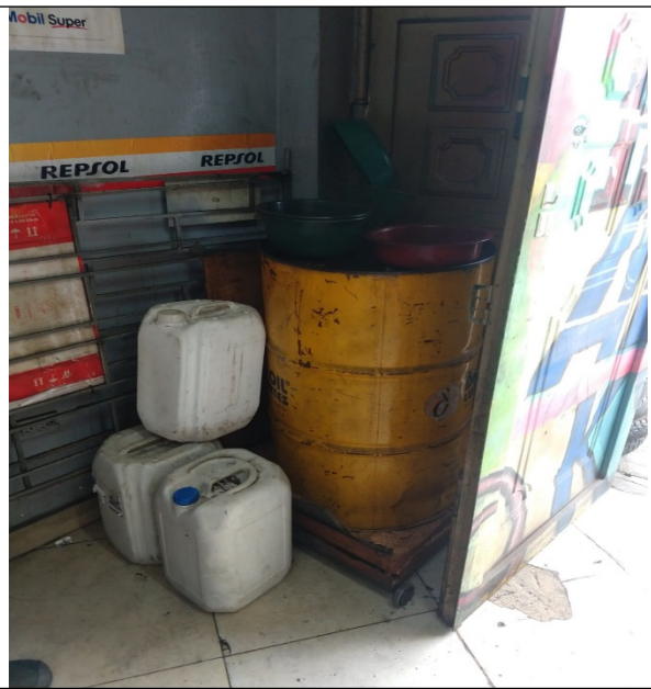
Foto 4. Vista general acopio aceites usados.