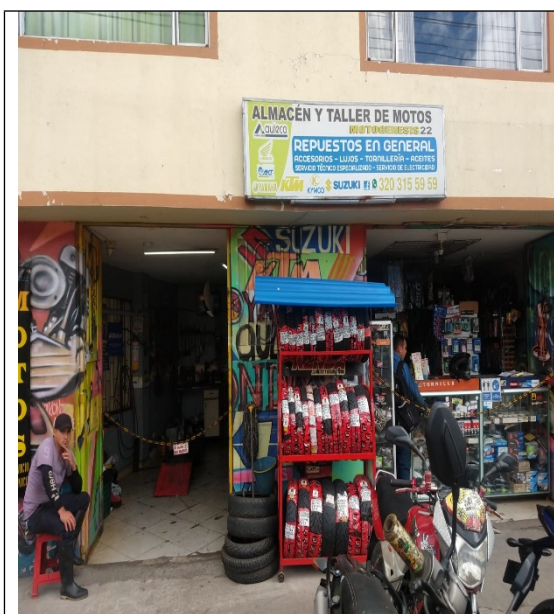
Foto 1. Vista general de la Publicidad Exterior Visual.

Por lo anterior se procede a realizar visita de seguimiento (Tercera visita) el día 07 de julio de 2022 al establecimiento MOTO GENESIS 22 de la razón social MOTO GENESIS 22 , con el fin de verificar el cumplimiento del requerimiento SDA 2020EE63145 del 25 de marzo de 2020 , evidenciando que el establecimiento no ha cumplido con lo solicitado en el requerimiento mencionado en el presente párrafo CON RESPECTO A: no se encuentra registrado como acopiador de llantas ante la Secretaría Distrital de Ambiente –SDA, no realiza el reporte mensual de las llantas almacenadas, gestionadas y/o vendidas en el aplicativo WEB de la SDA, no ofrece las garantías de almacenamiento de las llantas.